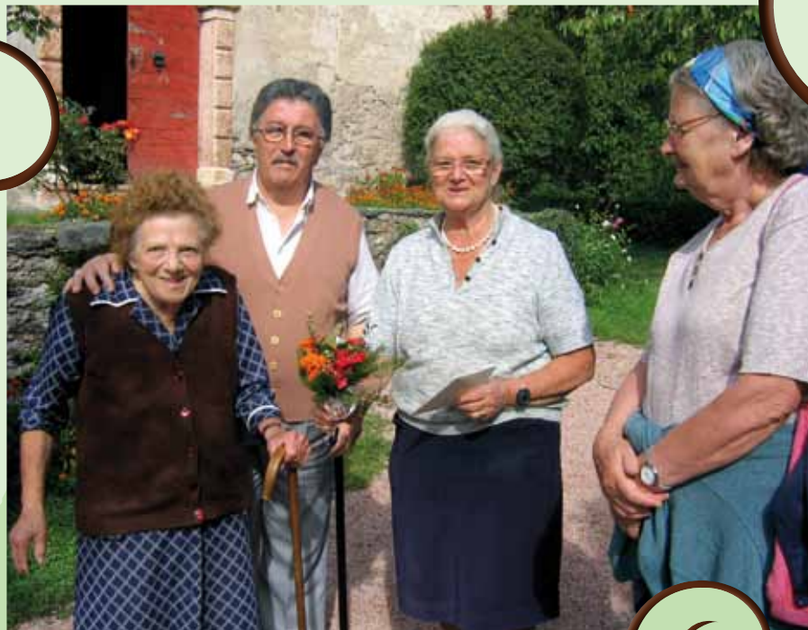
Casa Santa Maria